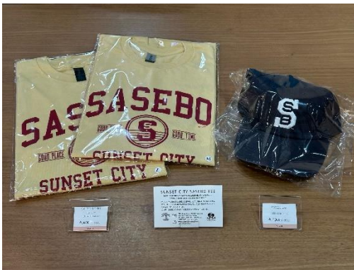
“サンセット シティ サセボ” Tシャツ 4,400円（税込）

佐世保を愛するデザイナー中山雄一さん（愛称RICKYさん）がデザインする商品は70, 80年代のアメリカンスタイルにアレンジされているこれぞ“SASEBOスタイル”です！