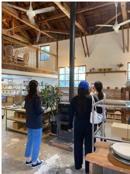
(波佐見町 西の原での撮影)

ウェブサイトを韓国ユーザーに紹介するため、韓国から人気ブロガー2名を招聘しました。サイトの紹介と共に圏域の魅力を伝えるブログを準備中で、9月末までにはネイバーブログで発信予定です。