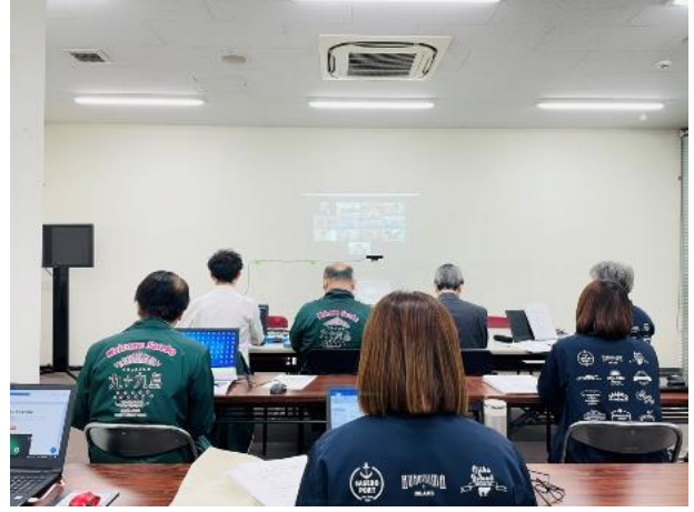
推進委員会 開催中の様子