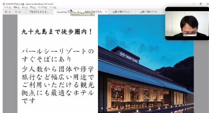
説明会 開催中の様子