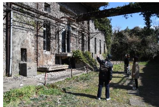
針尾送信所ツアー 様子の一部