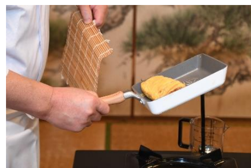
寿司づくり体験 様子の一部