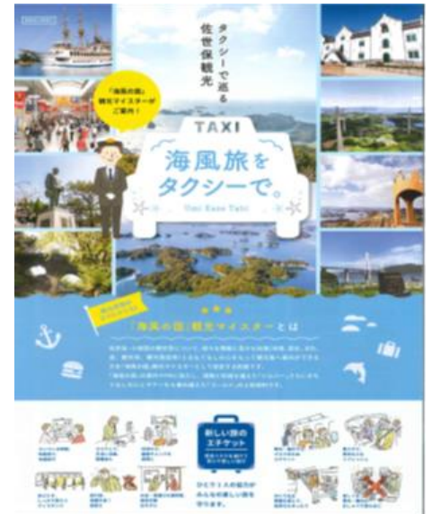
新体験プログラム ポストカードデザイン