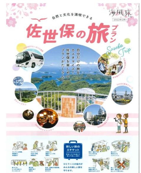
新体験プログラム ポストカードデザイン

SASEBO クルーズバス海風や SASEBO 軍港クルーズ、海軍さんの散歩道、タクシープランなどを掲載しており、自分だけの旅をカスタムできる1冊となっております。