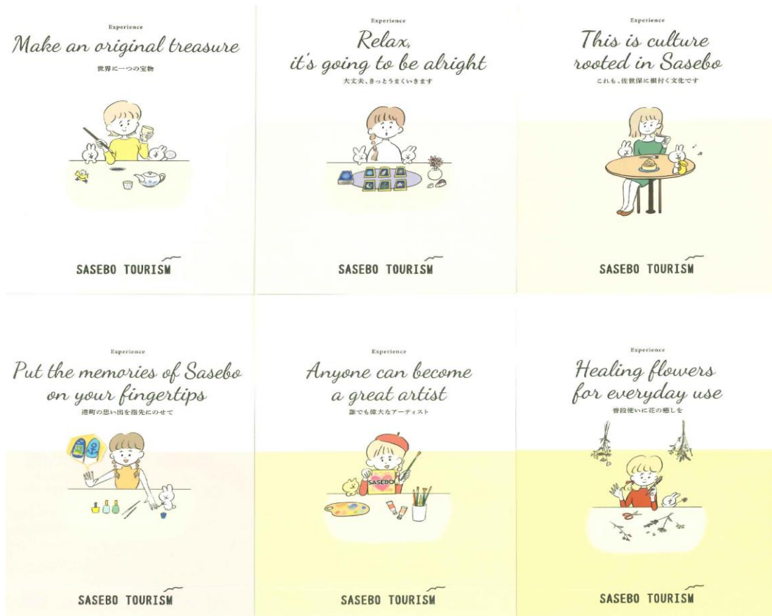
新体験プログラム ポストカードデザイン