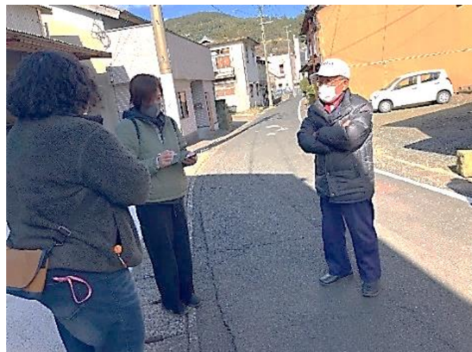
ガイド人材育成研修様子